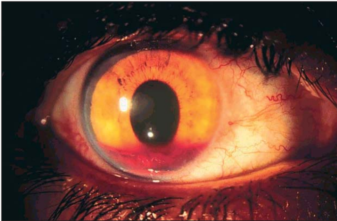
Figura 1. Hifema traumático.